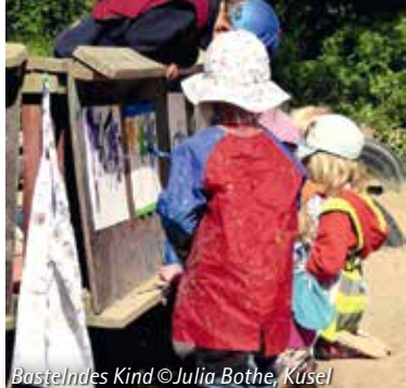
Bastelndes Kind