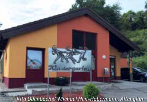
Kita Odenbach