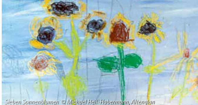
Sieben Sonnenblumen