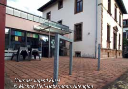
Haus der Jugend Kusel