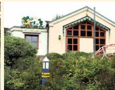
Kindertagesstätte „Drei Freunde“ © Michael Heil-Habermann, Altenglan (2 Fotos)