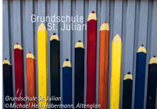
Grundschule St. Julian