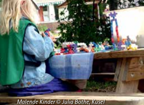
Malende Kinder