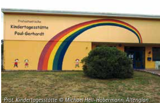
Prot. Kindertagesstätte