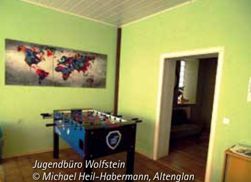
Jugendbüro Wolfstein