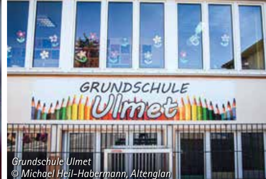
Grundschule Ulmet