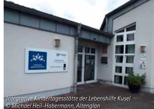
Integrative Kindertagesstätte der Lebenshilfe Kusel