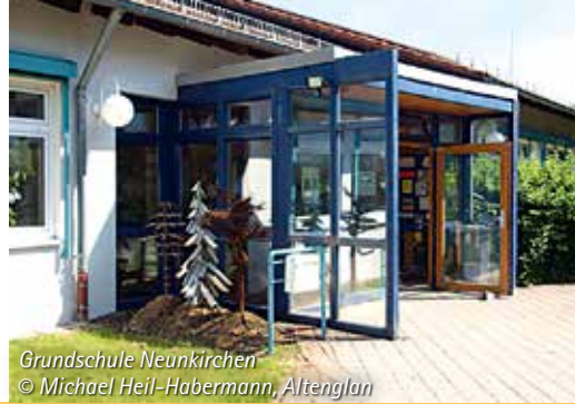
Grundschule Neunkirchen