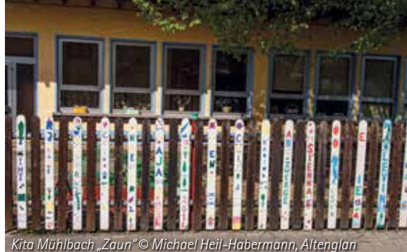
Kita Mühlbach „Zaun“