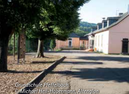
Grundschule Pfeffelbach