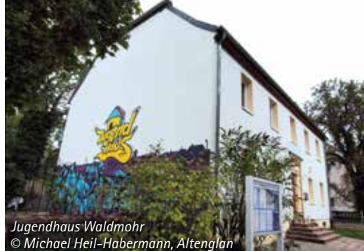
Jugendhaus Waldmohr