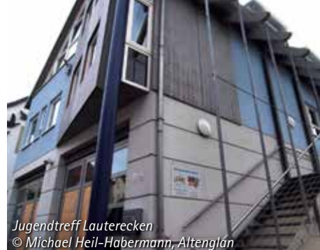
Jugendtreff Lauterecken