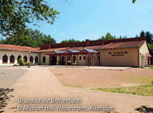
Grundschule Breitenbach