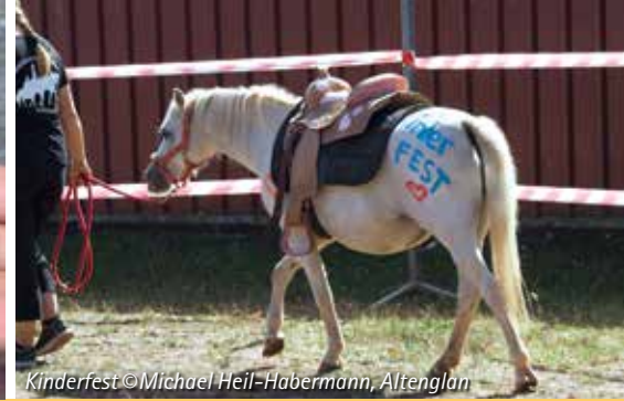
Kinderfest