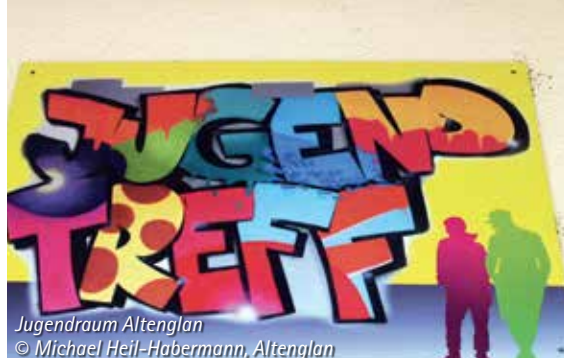
Jugendraum Altenglan