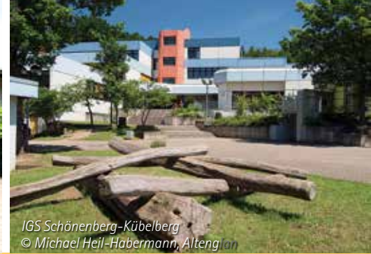
IGS Schönenberg-Kübelberg