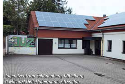
Jugendzentrum Schönenberg-Kübelberg