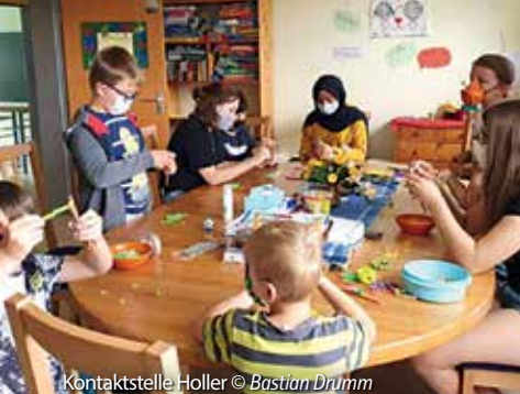
Kontaktstelle Holler